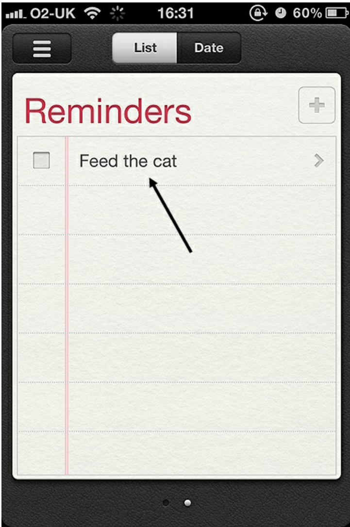
Cam 5: Nawr gallwch ddewis sut hoffech gael eich atgoffa. Cliciwch ar Remind Me .